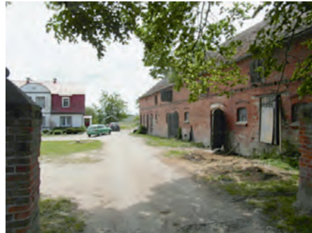
So könnte einer der Übernachtungsplätze für die Flüchtlinge ausgesehen haben.

Nahe an der Ostsee entlang ging es dann bis Kolobrzeg (Kolberg), der Stadt, die noch im März 1945 bis zum letzten Blutstropfen verteidigt werden sollte und nahezu völlig zerstört wurde. Bekannt wurde der Name „Kolberg“ durch den Monumentalfilm „Kolberg“, der im Auftrag Goebbels mit 18.500 Soldaten als Statisten von Veit Harlan gedreht wurde. Der Film sollte die letzten Kraftreserven der Deutschen mobilisieren.