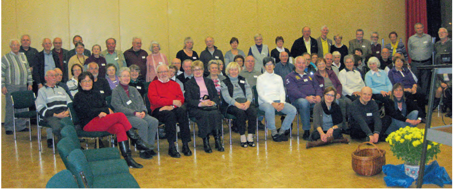
Gruppenbild der Teilnehmer bei der Herbsttagung in Hildesheim.