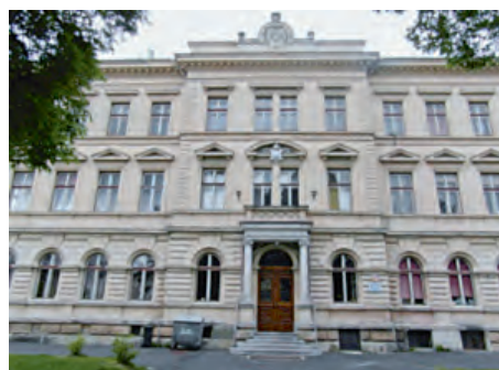
In diesem Schulgebäude könnte das Umsiedlungslager gewesen sein. Genauer war nicht zu erfahren.

der am besten erhaltenen historischen Stadtkerne in Nordböhmen wurde der Ort im Jahre 2006 mit dem Titel „Historische Stadt des Jahres 2005“ gewürdigt. Von 1938-1945 gehörte der vorher böhmische (habsburgische) Ort zum deutschen Reich.