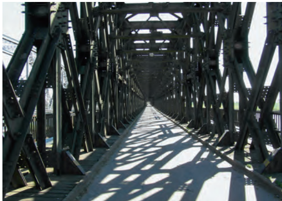
Die historische (wiederaufgebaute) Weichselbrücke bei Tczew (Dirschau).