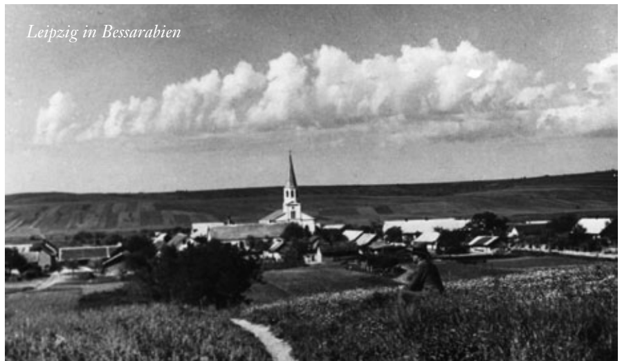
Leipzig in Bessarabien