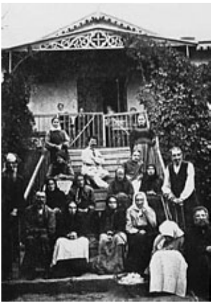
Abb. 3: Pflinglinge des Alexander-Asyls ca.1910.