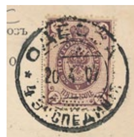
Abb. 2: Uni Odessa 1907 Medizinische Fakultät, Briefmarke von der Kartenrück- seite.