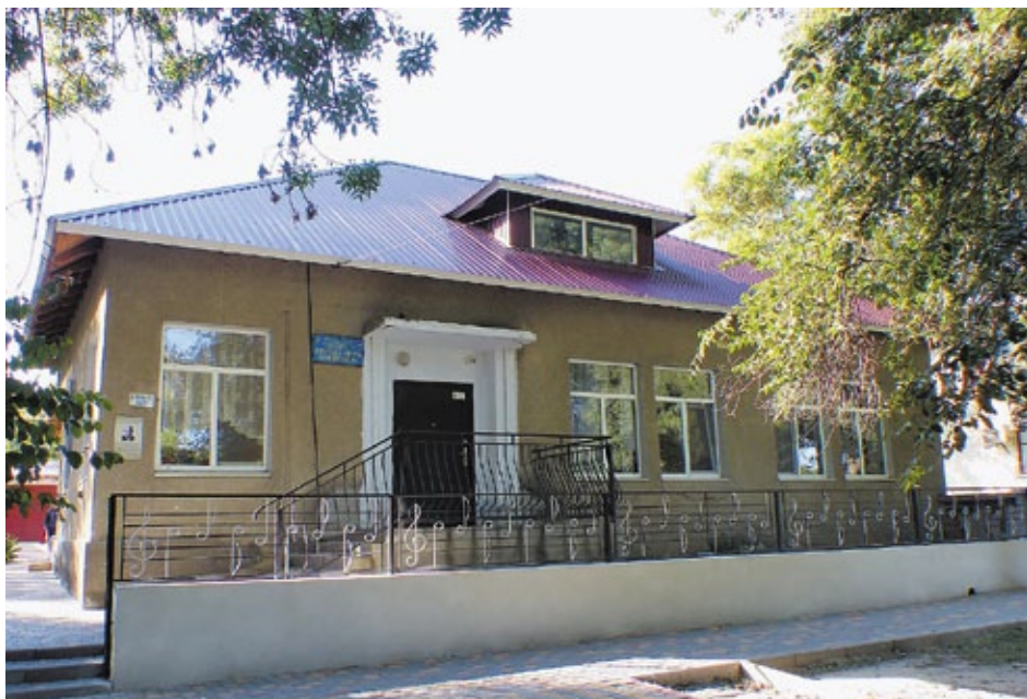
Abb. 10: Das schmiedeeiserne „Notengitter“ am Dr. Dobler-Haus kündigt vom heutigen Musizieren der Kinder und Jugendlichen in den Räumen von damals.