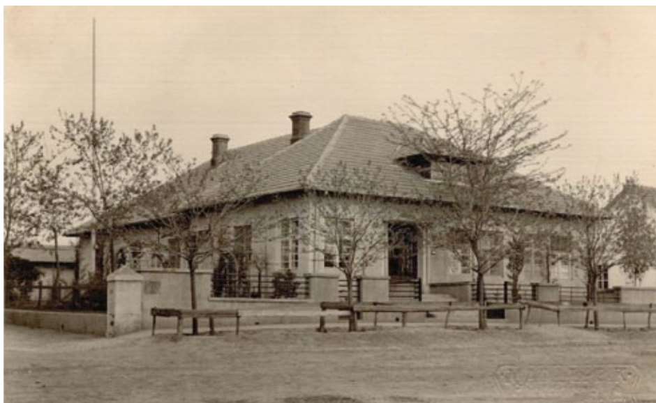
Abb. 9: Das Dobler-Haus zu bessarabischen Zeiten