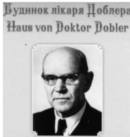
Abb. 8: 1888–1961