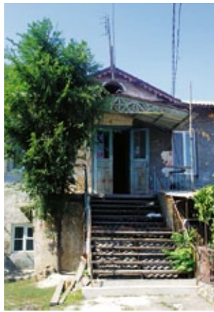
Abb. 4: Alexander-Asyl 2015.

Nach 5-jährigem Studium krönte er seine universitäre Ausbildung mit einer exzellenten Abschlussprüfung und erhielt von der medizinischen Fakultät das extrem seltene „Diplom mit dem Grad eines Arztes mit Auszeichnung“ im Jahre 1913 verliehen. Die Prüfungskommission dokumentierte wohl mit ihrer Bewertung bereits zu diesem Zeitpunkt, dass hier eine Persönlichkeit herangereift war, von der herausragende Leistungen zu erwarten seien.