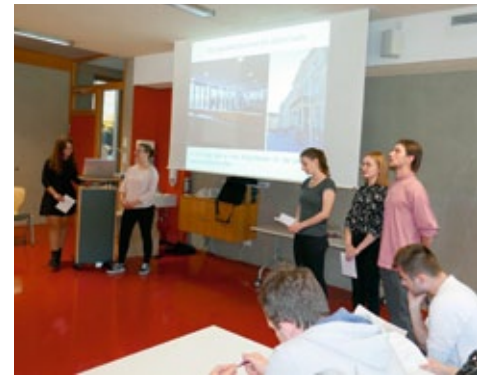
Eine Gruppe der Teilnehmer beim Jugendaustauschprojekt 2018, die ihre Ergebnisse aus dem Projekt präsentieren.

Der jetzige Bundesvorstand hat mit seinen Beschlüssen wichtige Entschei-