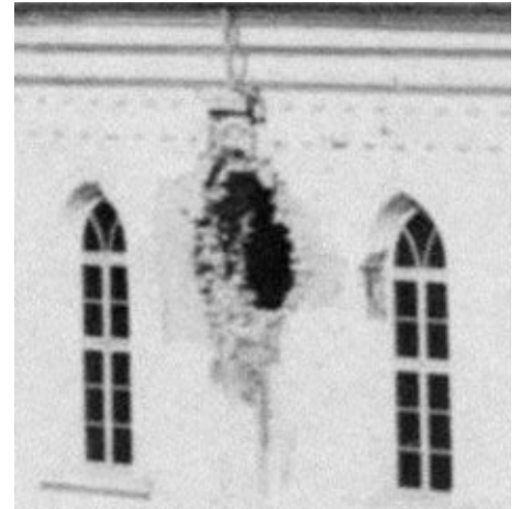
Vom „Treffer“ der Kirche existiert ein Bild (entnommen aus der Projektbeschreibung „Offene Kirche Malkotsch“).

waren ... der bulgarische Armee. Da die Kirche auch ein Volltreffer bekommen hat, da konnten keine Gottesdienste mehr darin gehalten werden. Gottesdienst wurde dann im Pfarrhaus gehalten, in der Schule, und auch beim Jakob Türk in seinem neue Haus. Dieser Volltreffer ist auf der [Seite] des Mutter Jesus Altar oben im Dach reingeschlagen und ist an der Wandseite durch geschlagen wo das fünfte Stationbild verschwunden.