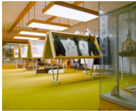
Raum „drei“ unseres Heimatmuseums in unserem Haus der Bessarabiendeutschen, den wir gerne neu gestalten wollen

Haus der Bessarabiendeutschen in Stuttgart, Florianstraße 17, Am „Bessarabienplatz“