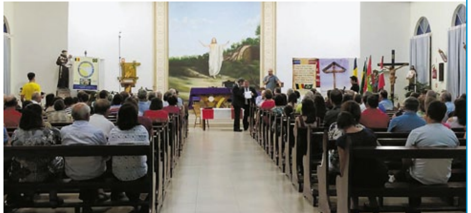
Fest-Gottesdienst in der Ev. Luth. Kirche in Mondai

Vom Ufer des Rio Uruguay herauf erklingt Musik: Ein festlich geschmückter Umzug, Ochsen-Gespanne, Männer