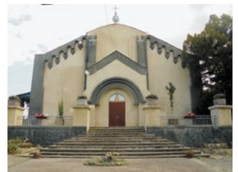
Kirche in Pervomaisc Moldova