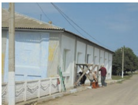
Schule in Wittenberg