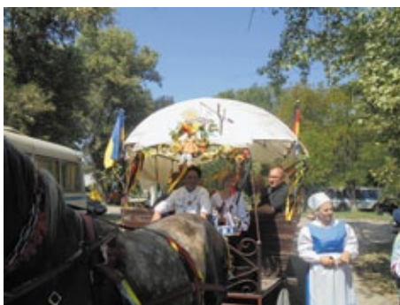
Jahrmarkt in Tarutino