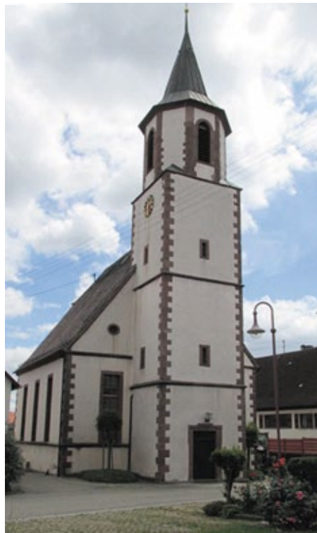
Kirche in Dürrenmettstetten