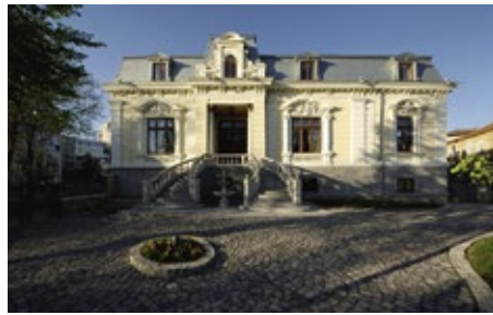
Der Ausstellungsort: Haus Avramide in Tulcea

(der Beitrag über Malkotsch/Malcoci beginnt etwa ab Minute 12:20 bis Minute 27), die Übersetzung der Redebeiträge auf https://www.dobrukscha.eu/doc/Redebeitr%C3%A4ge_RO_OKM_Tulcea_deutsch.pdf