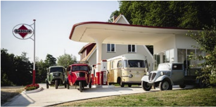
Oldtimer an der 1950er-Jahre-Tankstelle in der Königsberger Straße