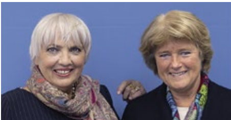
Claudia Roth mit ihrer Amtsvorgängerin Monika Grütters.

Wechsel der Kulturstatsministerinnen: In der neuen Ampel-Koalition hat Claudia Roth (Grüne) die Position von Monika Grütters (CDU) übernommen. Die studierte Theaterwissenschaftlerin, die jahrzehntelang selbst in der Kulturszene aktiv war, freut sich nach eigener Angabe darauf, mit ihrer neuen Aufgabe mehr Gestaltungsmöglichkeiten zu bekommen. Neu wird für sie sein, sich auch um andere Kulturgüter wie Museen, Archive und Bibliotheken sowie die für uns wichtige Erhaltung der Gedenkkultur zu engagieren und diese zu fördern. Wir vom Bessarabiendeutschen Verein hoffen natürlich auch weiterhin auf Unterstützung der Bundesbeauftragten für Kultur und Medien in der Person von Claudia Roth.