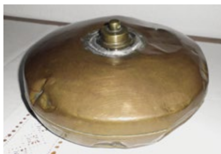
Dank kupferner Wärmflasche ein warmes Bett zur kalten Jahreszeit

Das härtere Messing war zum Einschneiden des Gewindes besser geeignet und wurde deshalb für den Verschluss eingesetzt. Um etwa 1520 gab es die ersten Exemplare aus Zinn. Sie wurden zunächst in