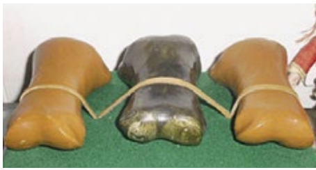
Knochahutscha: Kinderspielzeug aus Pferdeknochen