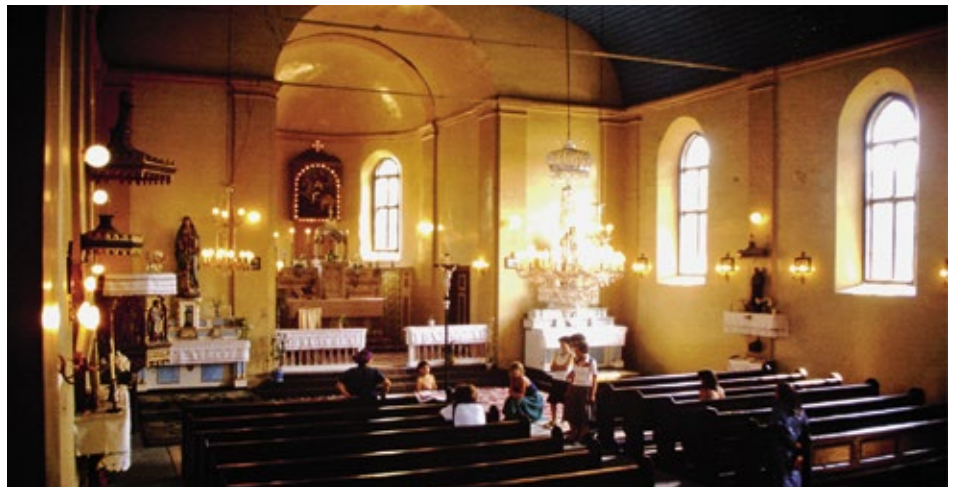
Innenansicht der Kirche Malkotsch in den 1980er