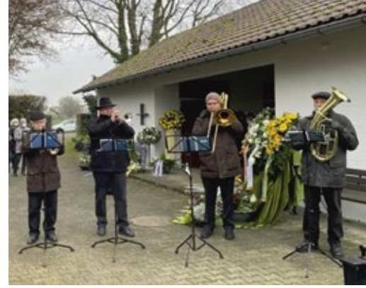
Beisetzung auf dem Friedhof in Rielingshausen