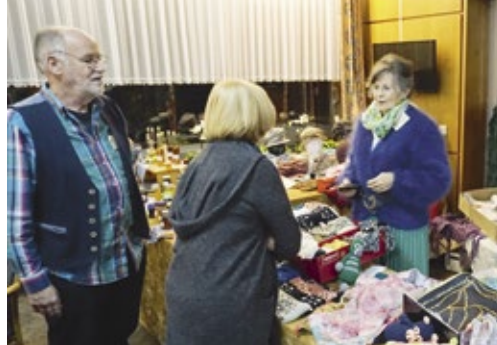
Angeregte Gespräche am Verkaufsstand