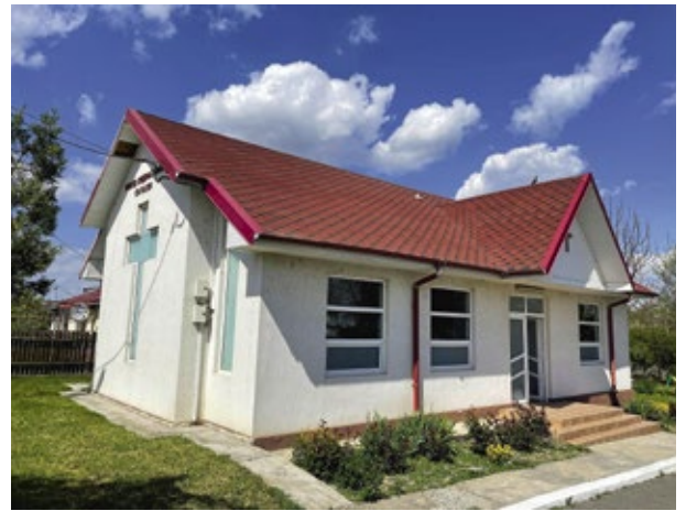
Kapelle Baptistengemeinde Cataloi 2021