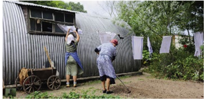
Personale Vermittlung, Gelebte Geschichte 1945 in der Nissenbütte

Anfang Oktober 2021 verkündete der Deutsche Tourismusverband (DTV) die Nominierten für den 17. „Deutschen Tourismuspreis“. Aus 72 eingegangenen Bewerbungen von Tourismusprojekten in Deutschland wählte die Jury aus Tourismusexperten und Fachjournalisten fünf Wettbewerbsbeiträge aus, darunter das Freilichtmuseum am Kiekeberg. Kriterien