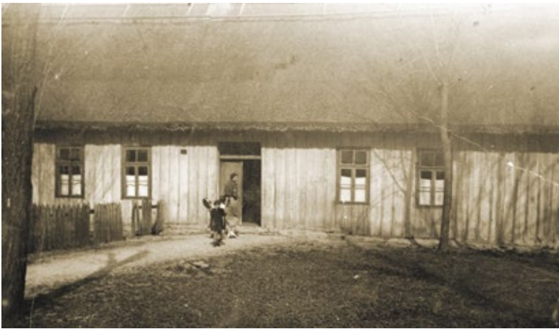
Bethaus Baptistengemeinde Cataloi in den 1930er Jahren