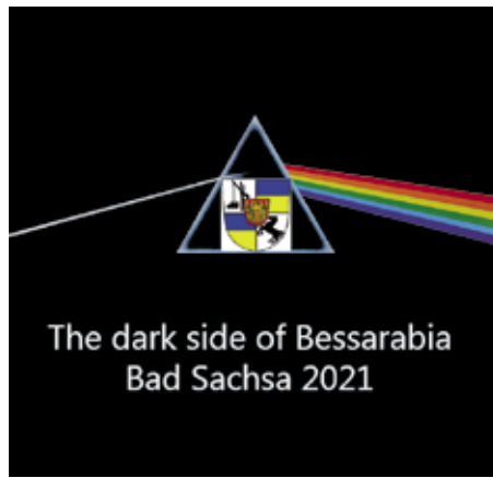
Eine kleine Provokation von Manfred Bolte: The dark side of Bessarabia.