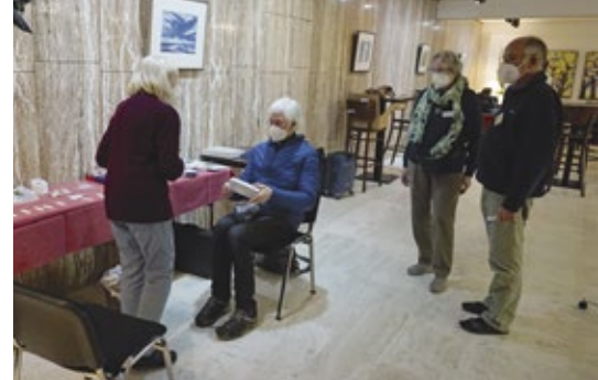
Ein Corona-Test zur Begrüßung

gewöhnlich, aber sehr lebhaft und durchaus zielführend. Insgesamt ergab sich ein recht umfassendes Bild über die sozialen Sicherungssysteme in Bessarabien.