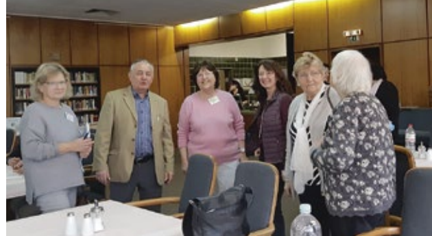
Diskussionsrunde nach dem Vortrag