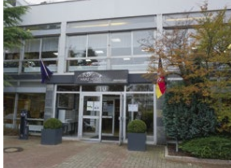
Ein herbstliches Zusammentreffen im Harzhotel und Gästehaus in Bad Sachsa