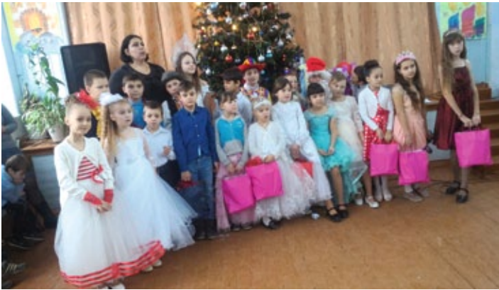
Dank der Spende konnten sich viele Kinder in Hirtenheim über die schönen Geschenktüten freuen