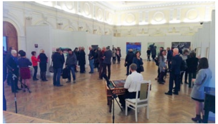
Eröffnung mit Cymbalspieler

Publikums auf solche zeitgenössischen Strömungen der westlichen Kunst erweitern.