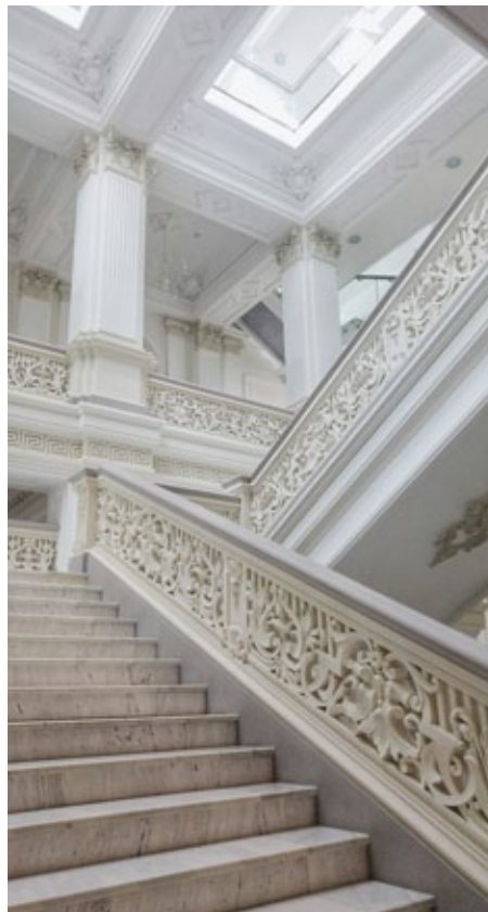
Treppenhaus des Nationalen Kunstmuseums

Das Nationale Kunstmuseum im Zentrum der Hauptstadt ist, besonders im Innern, ein prächtiges Stadtpalais. Es wurde um 1880 von Alexander Bernadazzi, dem renommierten Stadtarchitekten deutschschweizerischer Herkunft, der auch Odesa maßgeblich geprägt hat, als Mädchengymnasium im opulenten Stil des russischen Spätklassizismus gebaut. 2016 wurde es mit rumänischer finanzieller Unterstützung aufwendig renoviert. Es verfügt über einen großen und prachtvollen Saal für Wechselausstellungen.