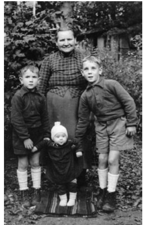
Im Jahr 1951 bekam die Familie eine eigene Wohnung in Louisenlund