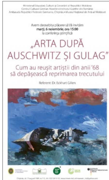
Einladung zur Konferenz

Unter dem Titel „Das 20. Jahrhundert“ schuf er Anfang des neuen Jahrhunderts eine Serie von großformatigen Gemälden mit spektakulären Schiffsuntergängen, die auch als Metaphern für den Untergang der politischen Herrschaftssysteme des 20. Jahrhunderts, des Nationalsozialismus und des Sowjetkommunismus, gelesen werden können.