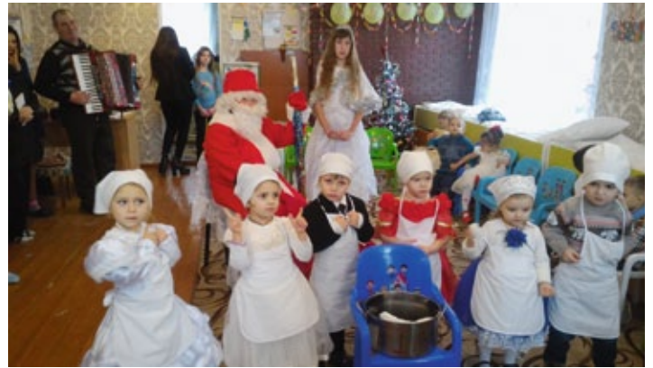
Ein gelungenes Fest mit Weihnachtsmann und -Engel