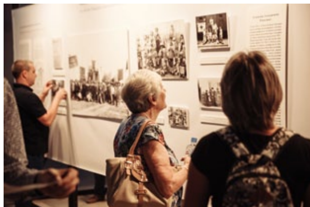
Großer Publikumsandrang bei der Eröffnung der Ausstellung zur Wolgadeutschen Autonomie in Moskau