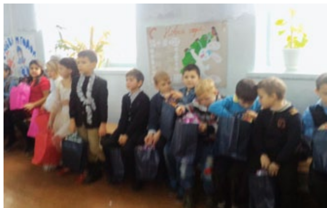
In Ciobanovka (Hirtenheim) hatte der Weihnachtsmann diesmal besonders viel zu tun.