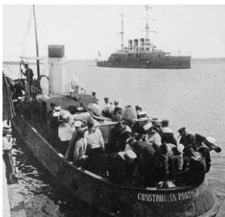
Mit einem Schlepper kommen Besatzungsmitglieder in Konstanza an Land

Immer mehr spitzte sich die Sache zu. Die ersten Rebellen wurden eingesperrt. Sie wurden bestraft. Die diensthabenden Offiziere liefen nur noch mit der Knute herum. Die Drohungen nahmen kein Ende, und doch konnten sie es nicht verhindern, dass sich die rebellierenden Matrosen im-