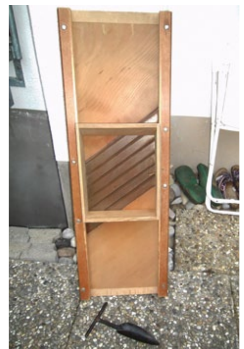
Krautbobel und Storzmesser