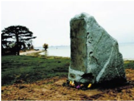
Heute befindet sich in Neu Sudaki im Andenken an das tragische Schicksal der Schweizer ein Denkmal der überfluteten Siedlungen