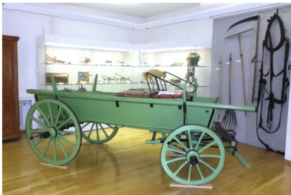
Im Heimatmuseum steht einer der drei Pferdewagen, die den weiten Weg von Bessarabien bis Deutschland geschafft haben.