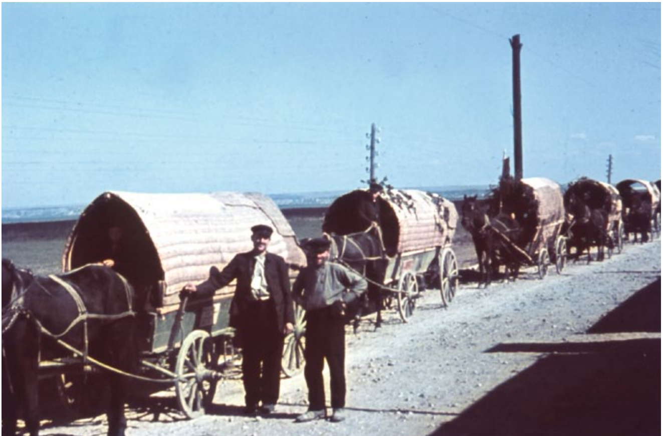
Umsiedlungstreck, Bessarabien 1940 – zu den Leserbriefen auf Seite 13