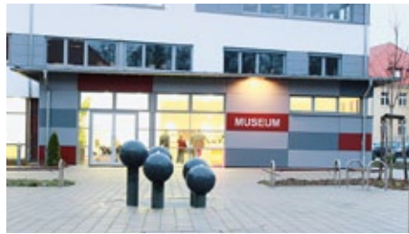
Blick auf das Museum für russlanddeutsche Kulturgeschichte in Detmold

Das Museum zeigt ein sehr modernes Gesicht und ist museumsdidaktisch sehr interessant aufgebaut. Im Erdgeschoss wird die Geschichte der Russlanddeutschen von der Einwanderung bis ca. 1940 gezeigt. Dabei werden moderne digitale Medien eingesetzt. Weiter werden Alltagsgegenstände wie Werkzeug, Kleidung, Geschirr, Reiseutensilien, Modelle der Siedlungshäuser usw. dargestellt. Mit mo-