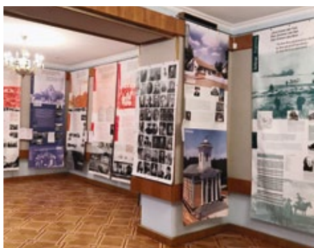
Ausstellung im Literaturmuseum