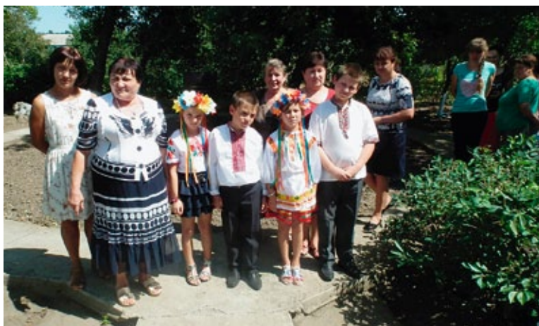
Lehrer und Kinder aus Mintschuna