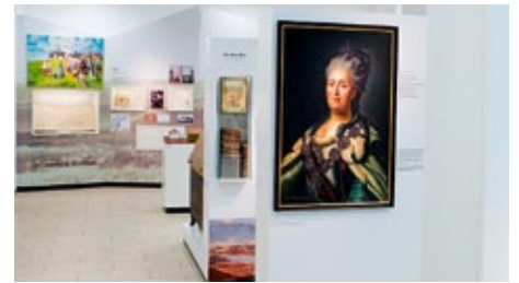
Ausschnitt aus dem Museum - Erdgeschoss