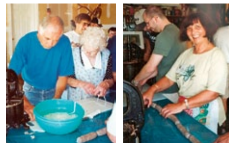
Aus der alten Wurstpresse wird die Masse in den vorbereiteten Darm gedrückt und geformt.

Habnerl, zahme und wilde Gänse und Trut- hähne lebten auf der Farm. Falls ein, drei oder vier Hühner oder irgendein anderer Vogel für eine Mahlzeit gebraucht wurden, ging man hi- naus, fing sie mit einem langen dünnen Stecken, an dessen Ende sich eine kleine Drahtschlaufe befand, hackte die Köpfe ab, brühte sie mit hei- ßem Wasser ab, rupfte die Federn, schlachtete sie und briet sie zum Abendessen. Huhn war gewöhnlich das Sonntagsgessen.