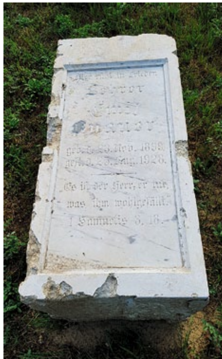
Abb.8: Grabstein Emil Knauer

halten geblieben. Doch sie präsentieren sich gegenwärtig noch auf einer völlig freien und nicht ansatzweise geschützten Fläche, die unsachgemäße Handlungen begünstigen könnte.