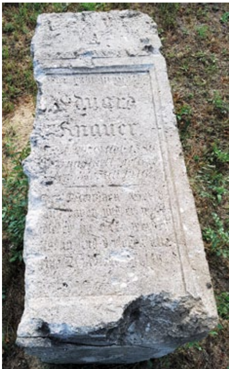
Abb.7: Grabstein Eduard Knauer