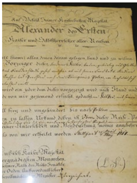
„Reisepass für Russland“

Im Anschluss an die szenischen Darstellungen wurde das Bessarabische Heimatlied in beiden Sprachen gesungen. Die etwas gedrückte Stimmung der Zuschauer