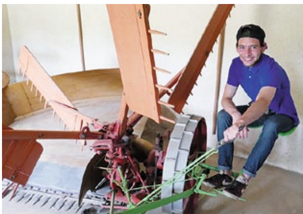
Bauernmuseum „Dr. Edwin Kelm in Friedenstal“