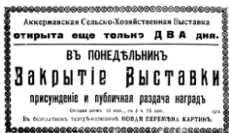
Abb. 12: Hinweis in Akkerman: Ausstellungsschluss in 2 Tagen