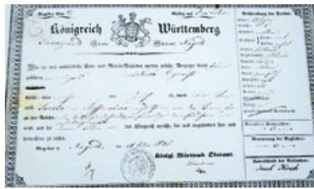
Entlassurkunde aus Württemberg

Brückenbauer zu sein zwischen der Vergangenheit und der Zukunft, denn, um mit August Bebel zu sprechen „nur wer die Vergangenheit kennt, kann die Gegenwart