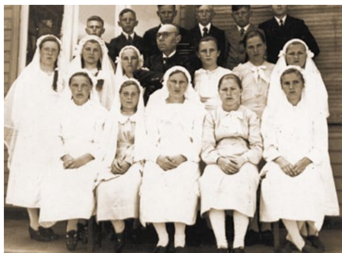
Konfirmation im Lager Kirschberg; ich stehe neben dem Pfarrer.

wir auch mit dem Pferdewagen in die nächste Stadt Tarutino, die ca. 16 km entfernt war.