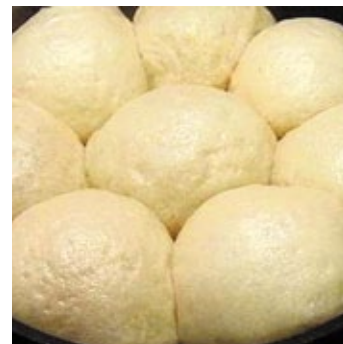
Dampfnudle – Ohne Worte!