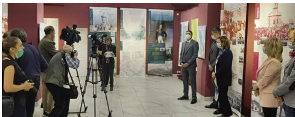
Eröffnung der Ausstellung in Tiraspol

Bereits seit 2019 gab es eine von der deutschen Botschaft in Chisinau vermittelte