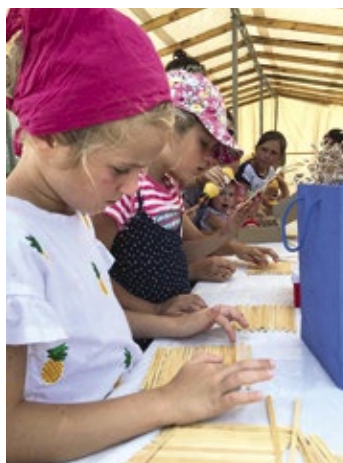
Über zwei Wochen bot die Gemeinde der Evangeliums-Christen-Baptisten in Shevtschenko den Kindern vielfältige Aktivitäten an