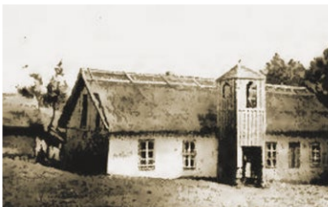
Bethaus Baptistengemeinde Cataloi vor 1922

Fortsetzung in einer der nächsten Ausgaben des Mitteilungsblattes.