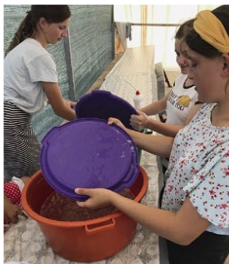
Beim gemeinsamen Abwaschen

Oftmals haben sie bis dahin von Gott, der Bibel und dem Glauben allgemein nicht viel erfahren. Die Gemeinschaft mit den anderen Kindern und Jugendlichen zu erleben bringt viele neue Erfahrungen und