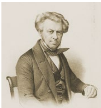
Johann Gerhard Oncken