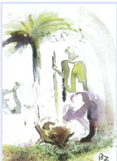
Stall von Betlehem

Aber eigentlich ist das in sich stimmig. Mit diesem Lied zur Osterzeit schließt sich der Kreis zu unserer Adventszeit. Denn die Alttestamentliche Lesung zum 1. Advent steht beim Propheten Sacharja. Und die Neutestamentliche Lesung ist der Einzug Jesu in Jerusalem aus dem