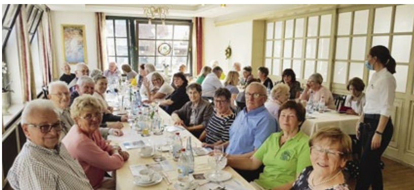
40 Gäste kamen zum Treffen

Rudersberg beerdigt. Er wurde 94 Jahre alt und war fast von Anfang an bis zum Schluss im Gnadentaler Ausschuss tätig. Er war in unserem Kreis der letzte aus der Erlebnisgeneration.