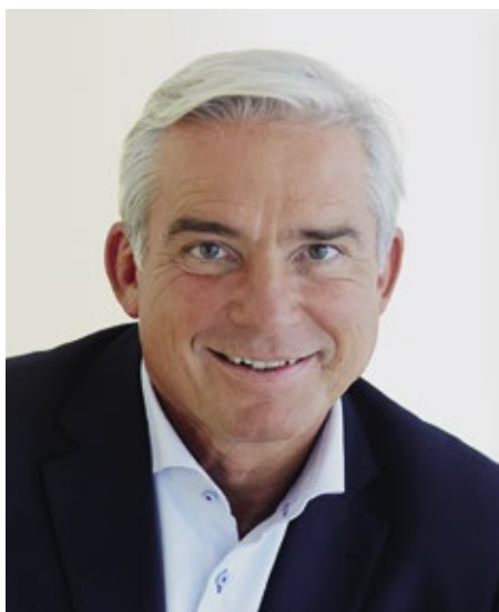
Thomas Strobl Stellvertretender Ministerpräsident, Minister des Inneren, für Digitalisierung und Kommunen des Landes Baden- Württemberg, Landesbeauftragter für Vertriebene und Spätaussiedler

Am 16. Oktober feierten wir das Landes-trachtenfest der Banater Schwaben in Göppingen und das 70-jährige Jubiläum der djo – Deutsche Jugend für Europa. Frauen in bunten Trachten, Männer mit ihren beeindruckenden Hüten, eine Reihe von erkennbar begeistert mitmachenden Kindern und Jugendlichen, schwungvolle Musik, leichtfüßiger Tanz – und das Ganze bei herrlichem Sonnenschein und in einem herbstlich geschmückten Saal. Die Feste haben uns – trotz des notwendigen Tragens von Masken – ein Stück Normalität geschenkt, ja Unbeschwertheit und Gemeinschaft spüren lassen. Die langjährige Tradition des landsmannschaftlichen