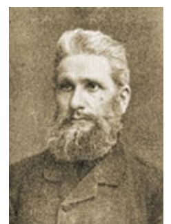
August Liebig

erfuhr ich, dass der Pascha die Anklage des Pastors, die in schrecklicher Verleumdung bestand, dem Gericht vorgelegt hatte, welches darüber, ohne dass Jemand von uns dabei gewesen wäre, zu unseren Gunsten entschied. Abends leitete ich in Catalui eine Bibelstunde und vollzog eine Trauung.“ (entnommen aus dem Missionsblatt 1868, Nr. 9, Seite 162)