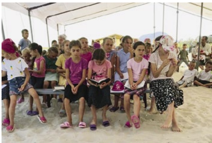
Kinder im Ferienlager am Schwarzen Meer