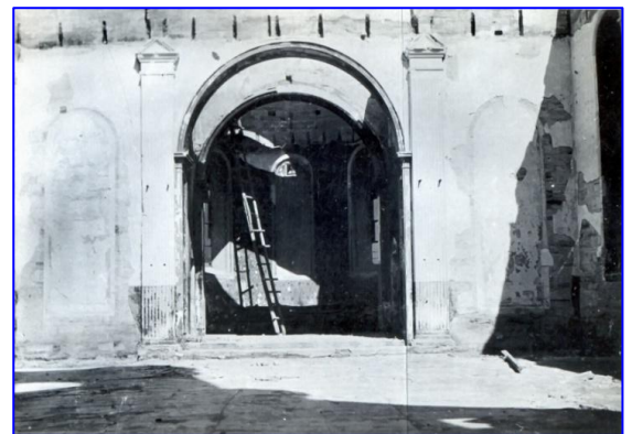
Der leere Altarraum