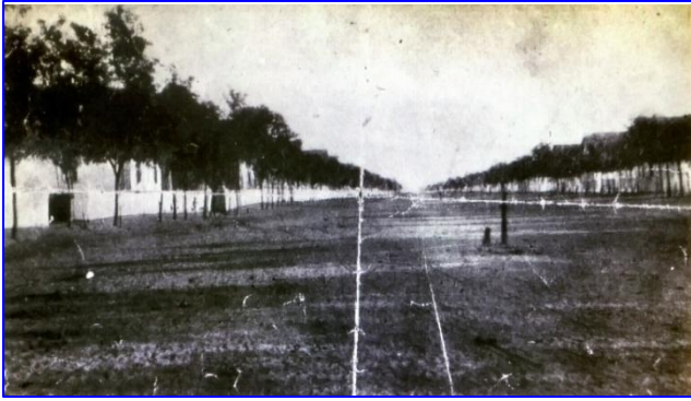
Mit Stacheldraht abgesperrte Hauptstraße

Die nachfolgenden Fotos von dem zerstörten Krasna sind aus dem Archiv von Josef Erker, Lehpfad 2a, 56220 Urmitz / Rh.