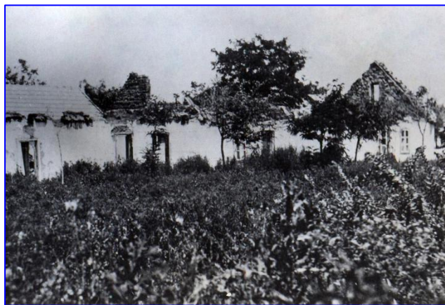
Zerstörter Bauernhof (Besitzer unbekannt)