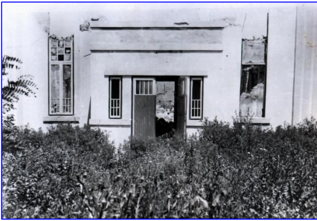
„Unser Heim“, zerstört und von Unkraut überwuchert