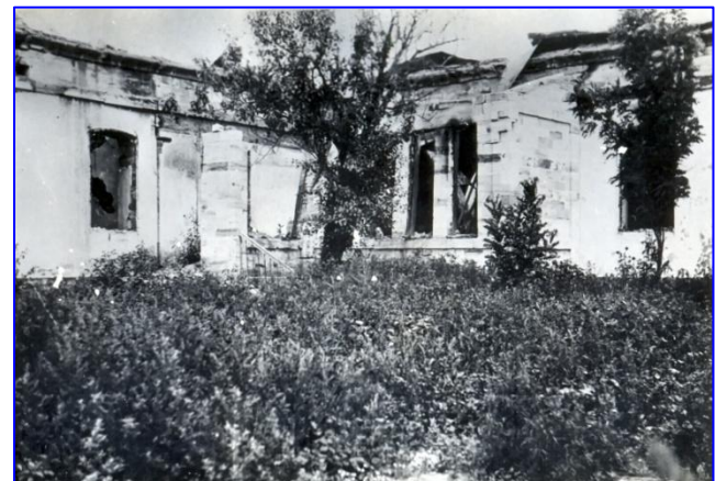
Das zerstörte Pastorat (Pfarrhaus)