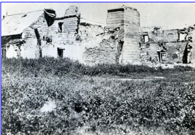
Das war einmal die Mühle