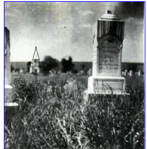
Der Friedhof, hinten die zerstörte Kapelle