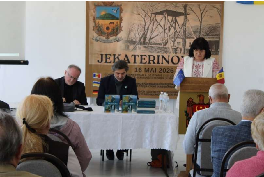
Treffen von Vertretern lokaler Museen aus dem ukrainischen Budschak und der Republik Moldau in Jekaterinowka (Ecaterinovca) am 16. Mai 2026