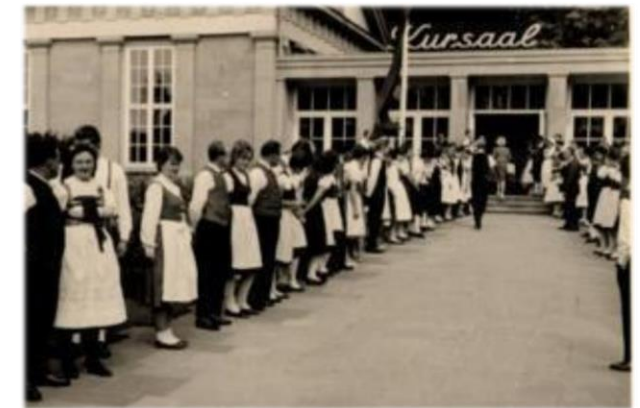
1960 – 10 Jahre Charta der Vertriebenen. Die Bessarabiendeutsche Jugend steht Spalier vor dem Kursaal Bad Cannstatt, wartend auf den Bundespräsidenten Heinrich Lübke.

80 Jahre – erinnern, erleben, gestalten.