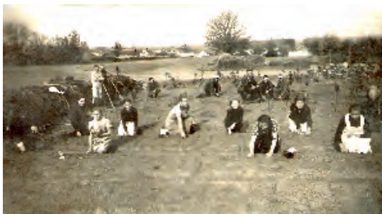
Der Schulgarten in Gnadenfeld. Die Schüler bei der Gartenarbeit. Frühjahr 1938.