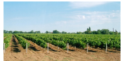
Unvergessenes Land Bessarabien

Sie können auch Ihre ganz persönliche Reise mit Ihrer Familie planen. Unser Hotel Haus LIMAN in Sergejewka steht von April bis Oktober auch für kleine Gruppen (ab 5 Personen) zur Verfügung. Unser Team holt Sie am Flughafen ab und betreut Sie während Ihres Aufenthalts in Bessarabien. Mit einem deutschsprachigen Fahrer können Sie Ihre ganz persönliche Reiseroute in die Heimatdörfer in der Ukraine und in Moldawien unternehmen.