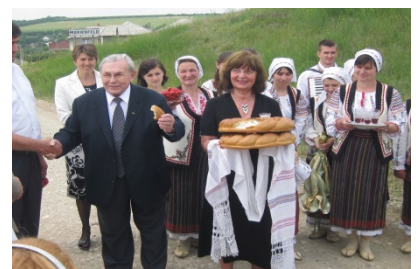
Menschen begegnen zu Gast bei Freunden