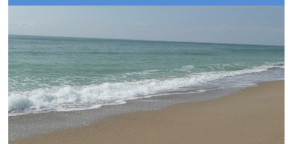
Zeit genießen am Schwarzen Meer