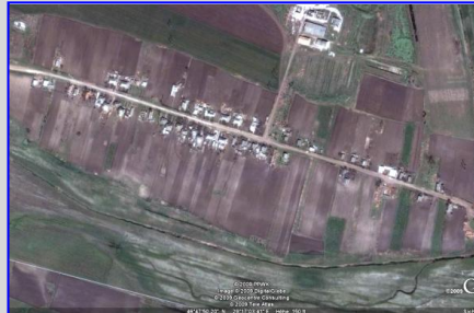
Balmas nach Google-earth