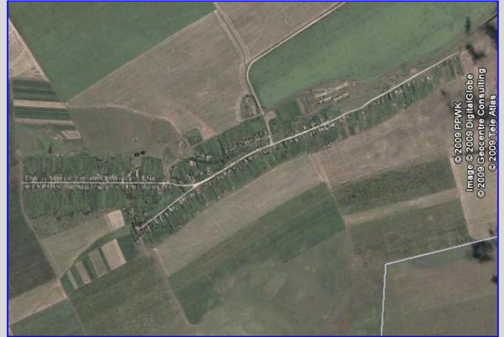
Larga nach Google-earth