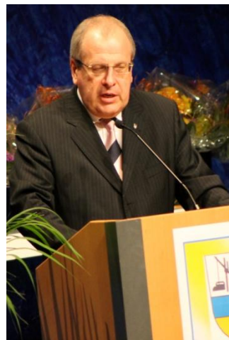
Botschafter der Ukraine in Stockholm, Stepanow