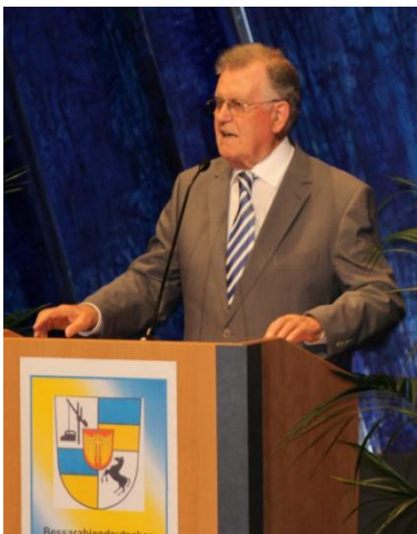
Alt-Ministerpräsident Erwin Teufel bei der Festrede.