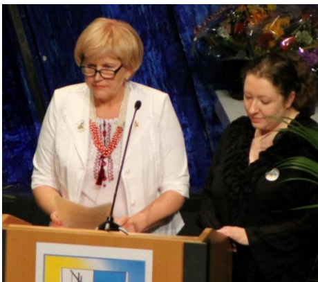
Landrätin vom Rayon Tatarbuniar.