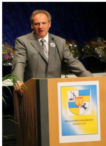
Innenminister von BW Reinhold Gall.