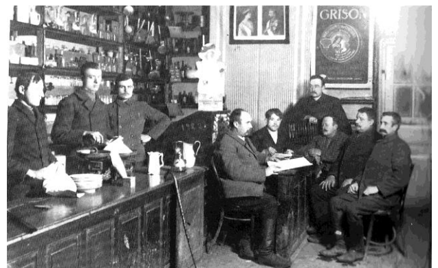
Konsumladen ca. 1923. Bildarchiv HM

Quelle: Heimatbuch Sarata 1822 – 1940, Herausgeber Christian Fiess Seite zusammengestellt von Heinz Fieß