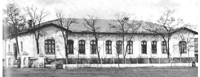
Die Alte Wernerschule.

Christian Friedrich Werner , dessen große Hinterlassenschaft den Grundstock bildete für den Bau der Kirche von Sarata (1843) und den Bau der Wernerschule/Zentralschule (1844) , der ersten deutschsprachigen Lehrerbildungsanstalt in Russland.